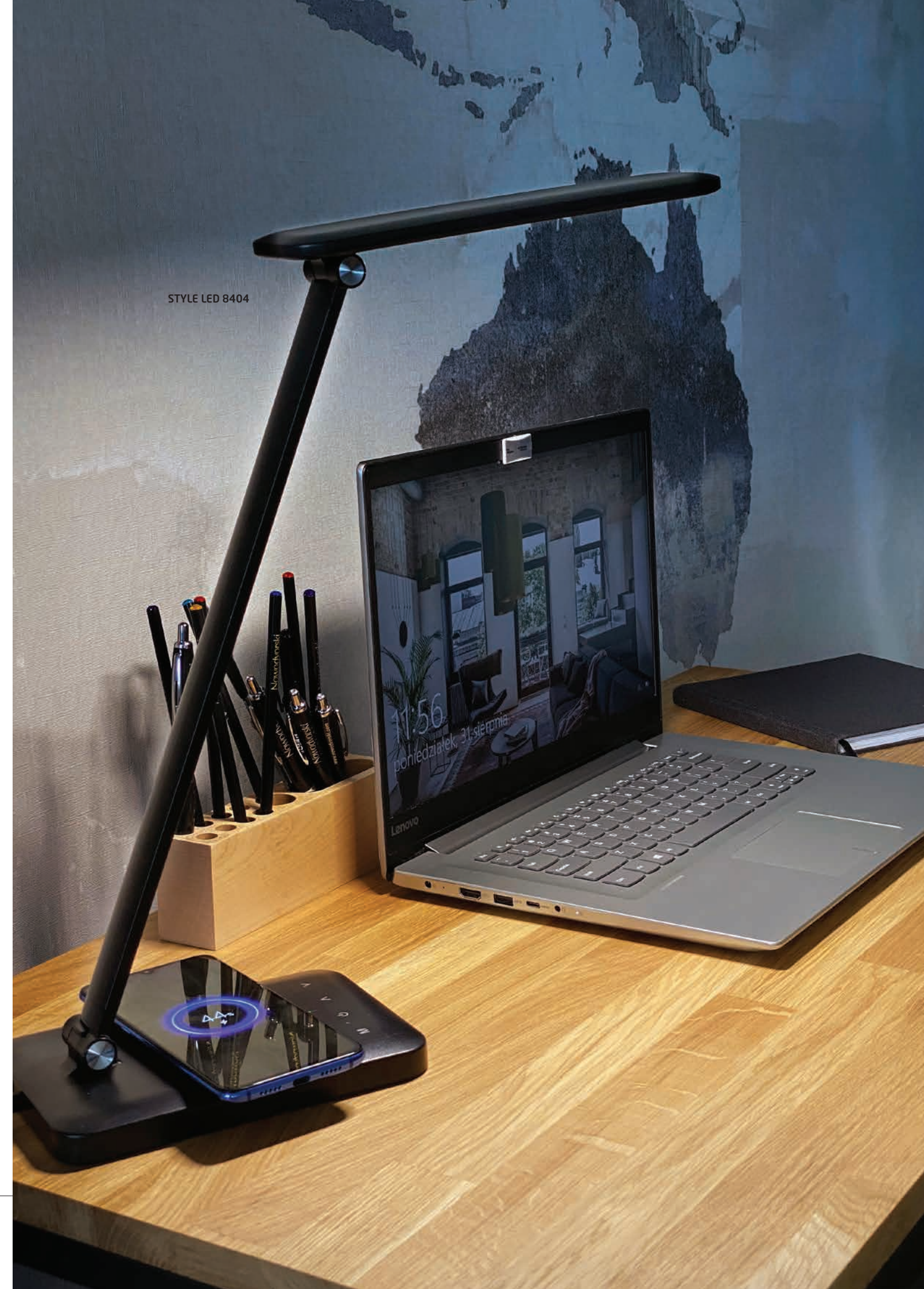
STYLE LED 8404